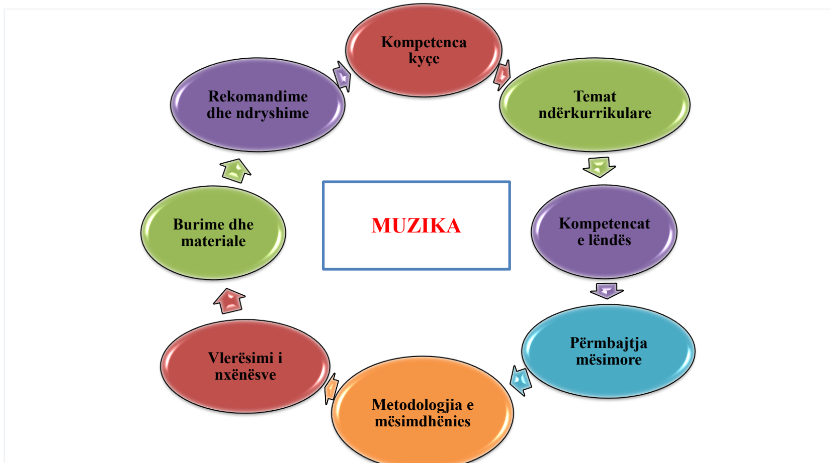
Diagrama 1. Përmbajtja e programi lëndor të muzikës