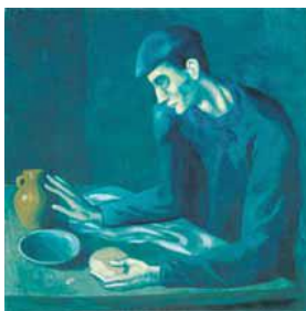
Pablo Pikaso, “Vakti i njeriut të verbër”, 1903

32. Vepra e mëposhtme e Pikasos i përket periudhës artistike të quajtur “Periudha blu”. Përshkruani karakteristikat e veprës duke u nisur nga psikologjia e ngjyrës. 2 pikë