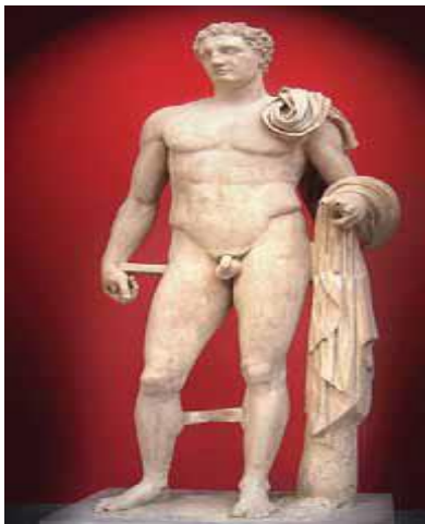
Fig. 3. Hermesi, skulpturë nga Lisiposi.