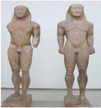
Fig. 1. Skulptura, 580 p.e.s.

29. Arti grek u zhvillua në katër periudha kryesore. Duke vëzhguar figurat e mëposhtme vendosni emrin e çdo periudhe përkatëse për çdo vepër arti. 4 pikë