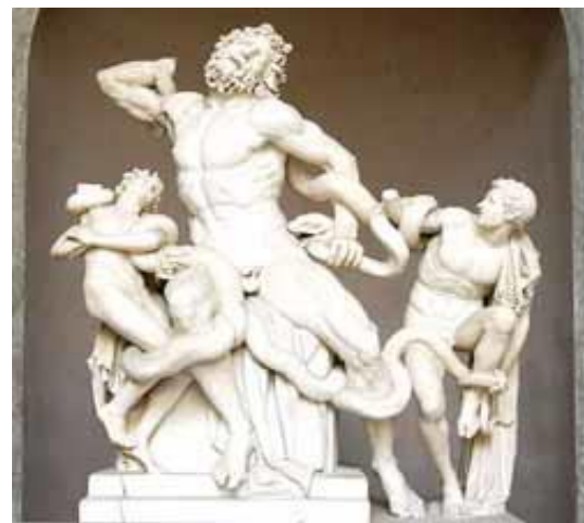
Fig. 4. Laokonti me të bijtë.