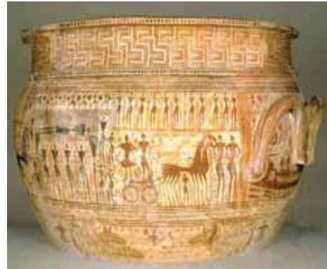
Fig. 2. Vazo qeramike