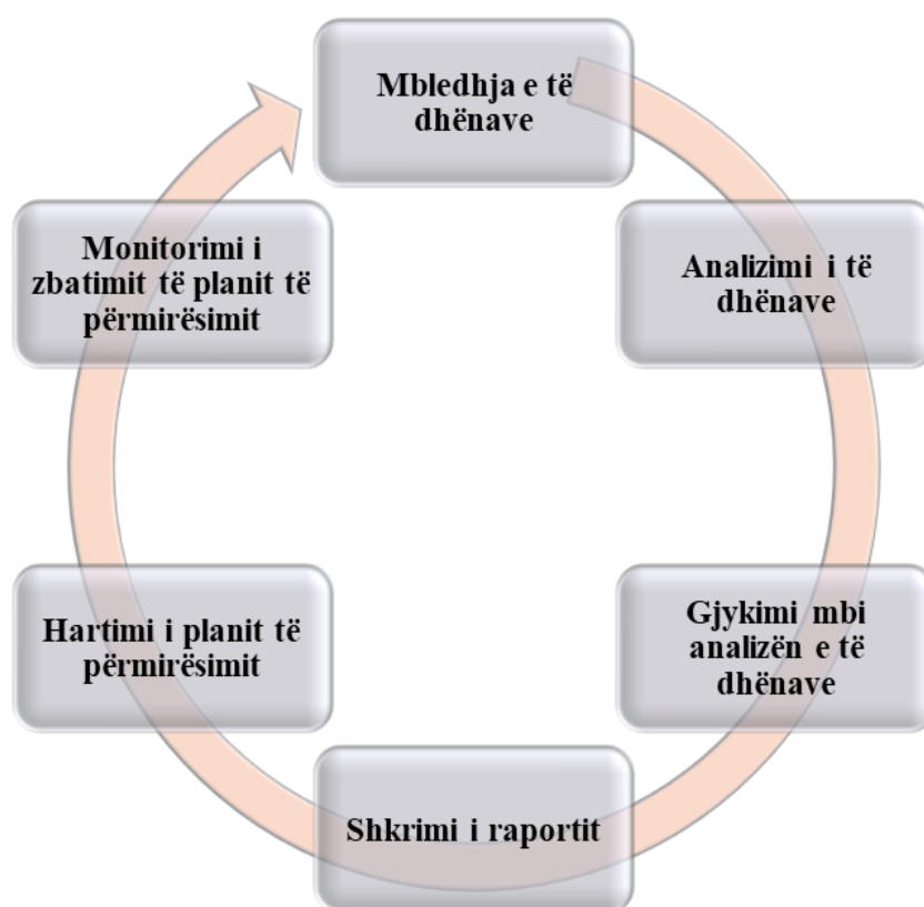
Figura 2: Etapat e procesit të vlerësimit të brendshëm

Dy etapat e para (mbledhja e të dhënave, analizimi i tyre) sigurojnë përfundime, në lidhje me pikat e forta dhe aspektet që kanë nevojë për ndryshim, në veprimtarinë mësimore-edukative