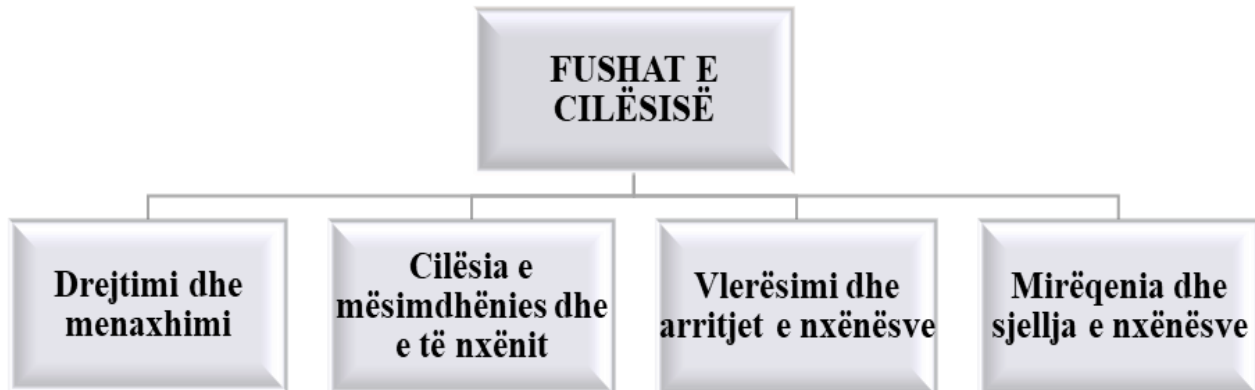
Grafiku 2: Fushat e cilësisë