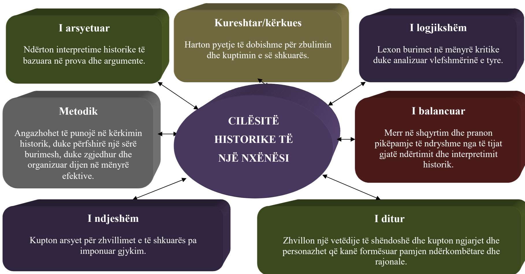
Diagrami 5. Cilësitë historike të nxënësit