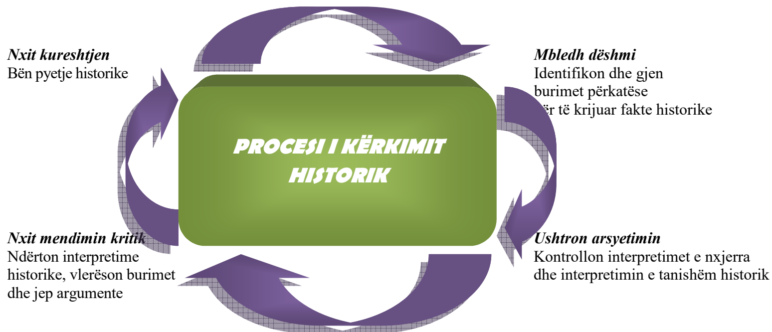
Figura 1. Procesi i kërkimit historik

Përdorimi i kërkimit historik duhet të jetë në qendër të mëimit të historisë, dhe mësuesit duhet t'i krijojnë mundësinë nxënësit, për të mësuar aftësitë e nevojshme përmes praktikës dhe angazhimit në kërkimin historik. Përdorimi i pyetjeve në çdo njësi mësimore siguron një pikë kontakti për nxënësit, për të kërkuar, sistemuar dhe analizuar informacion, në përgjigje të çështjeve që hulumtohen në programin mësimor. Qasja kërkimore, kur zbatohet në mënyrë efektive, zhvillon cilësitë historike dhe aftëson nxënësit të jenë të pavarur, krijues dhe mendimtarë kritik. Ajo nxit demonstrimin e kompetencave historike dhe kompetencave kyçe të nxënësve. Tabela e mëposhtme paraqet një përforcim të qasjes kërkimore, për të ndihmuar mësuesit në përdorimin e kësaj qasje.