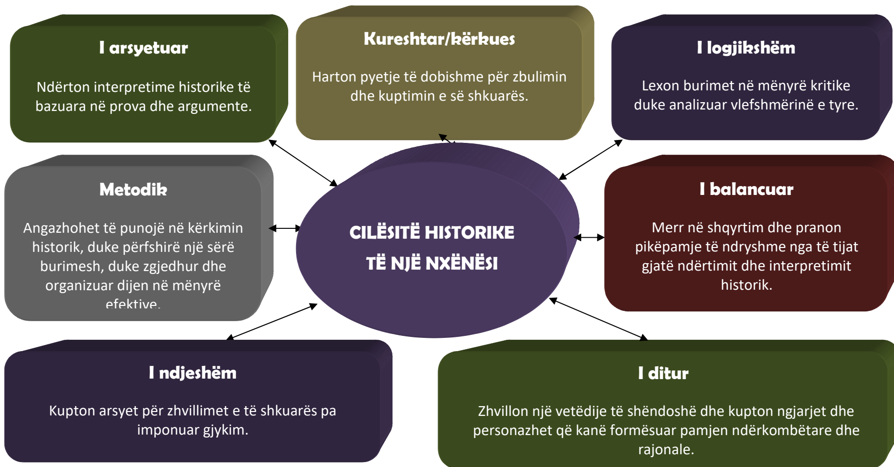
Diagrami4. Cilësitë historike të nxënësit