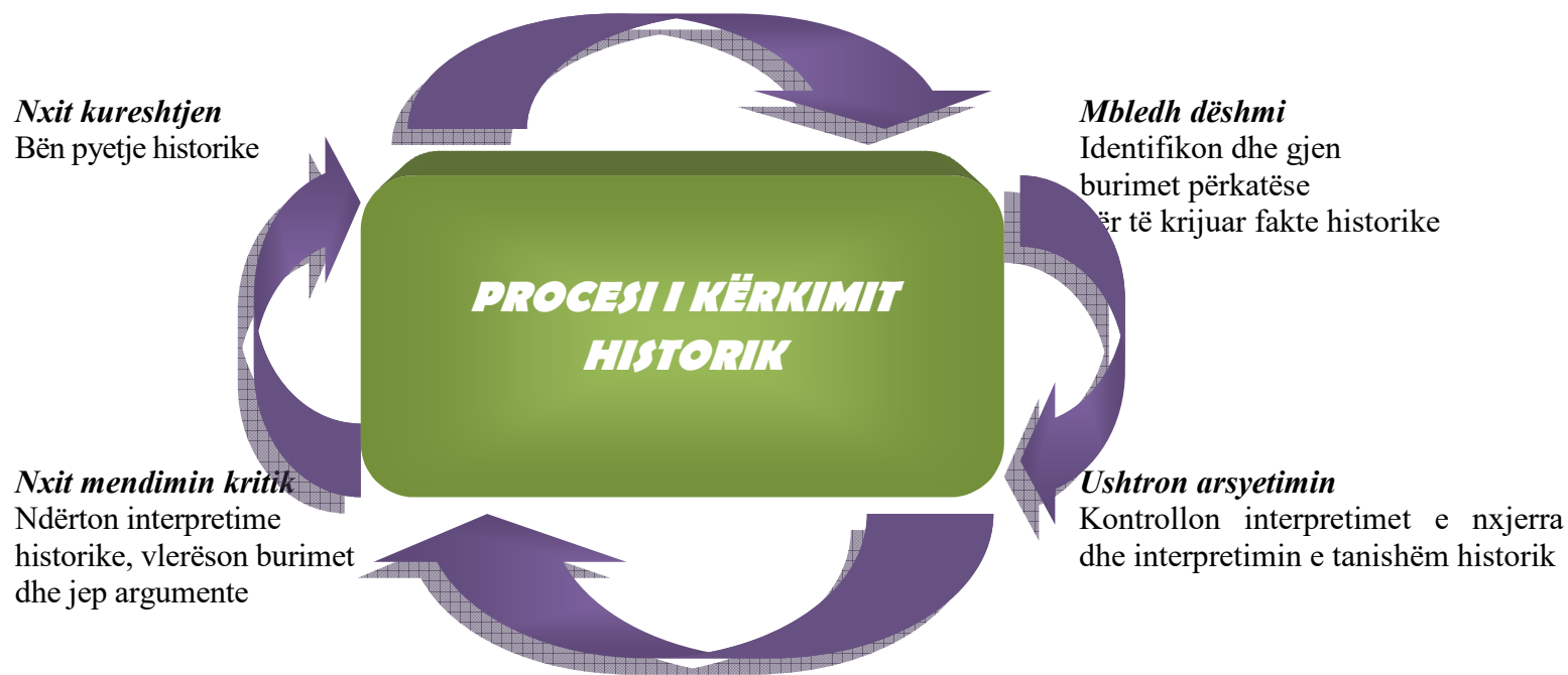
Figura 1. Procesi i kërkimit historik

Përdorimi i kërkimit historik duhet të jetë në qendër të mësimin të historisë, dhe mësuesit duhet t'i krijojnë mundësinë nxënësit, për të mësuar aftësitë e nevojshme përmes praktikës dhe angazhimit në kërkimin historik. Përdorimi i pyetjeve në çdo njësi mësimore siguron një pikë kontakti për nxënësit, për të kërkuar, sistemuar dhe analizuar informacion, në përgjigje të çështjeve që hulumtohen në programin mësimor. Qasja kërkimore, kur zbatohet në mënyrë efektive, zhvillon cilësitë historike dhe aftëson nxënësit të jenë të