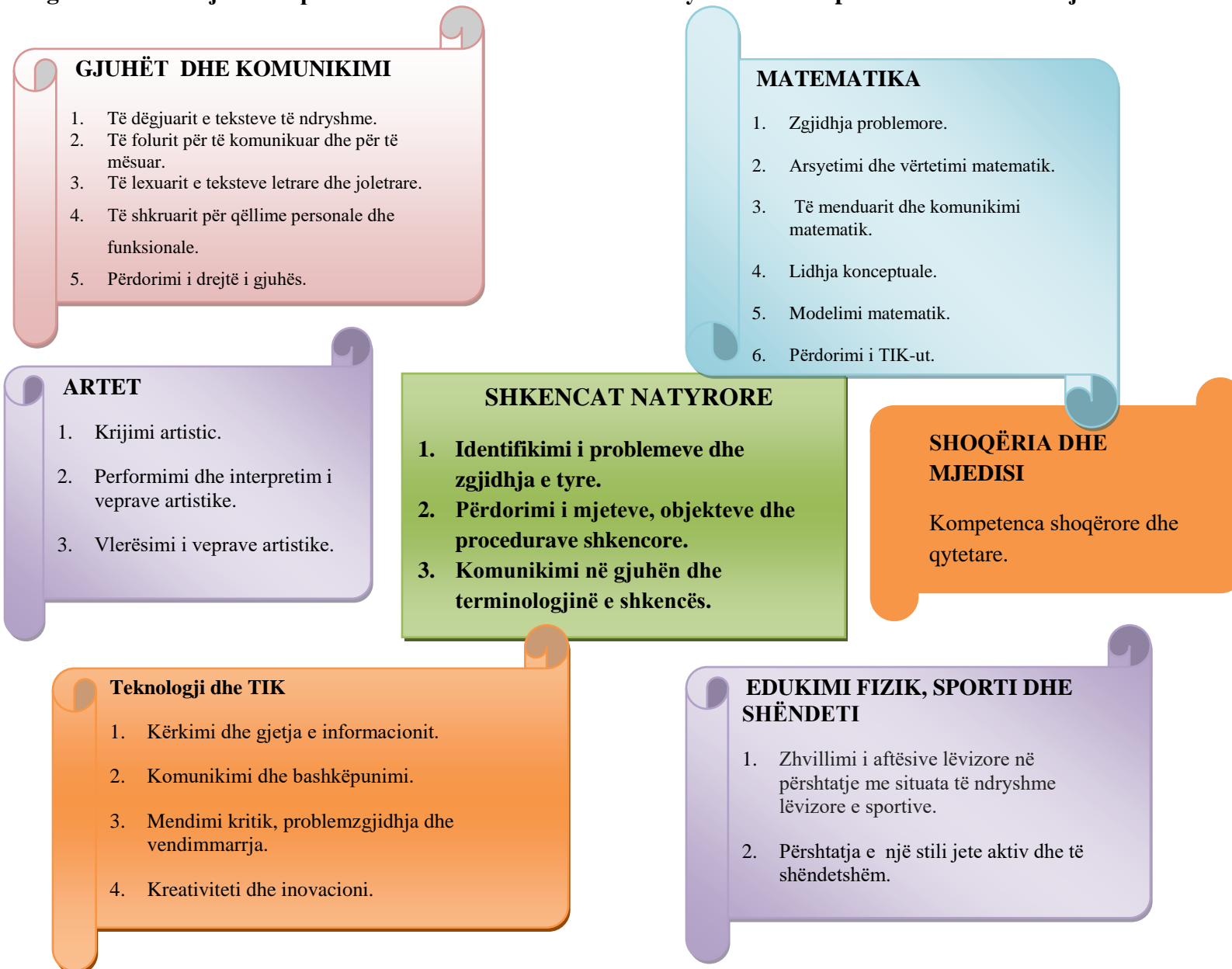
Diagrama 2 : Lidhja e kompetencave të fushës së shkencave natyrore me kompetencat e fushave të tjera.